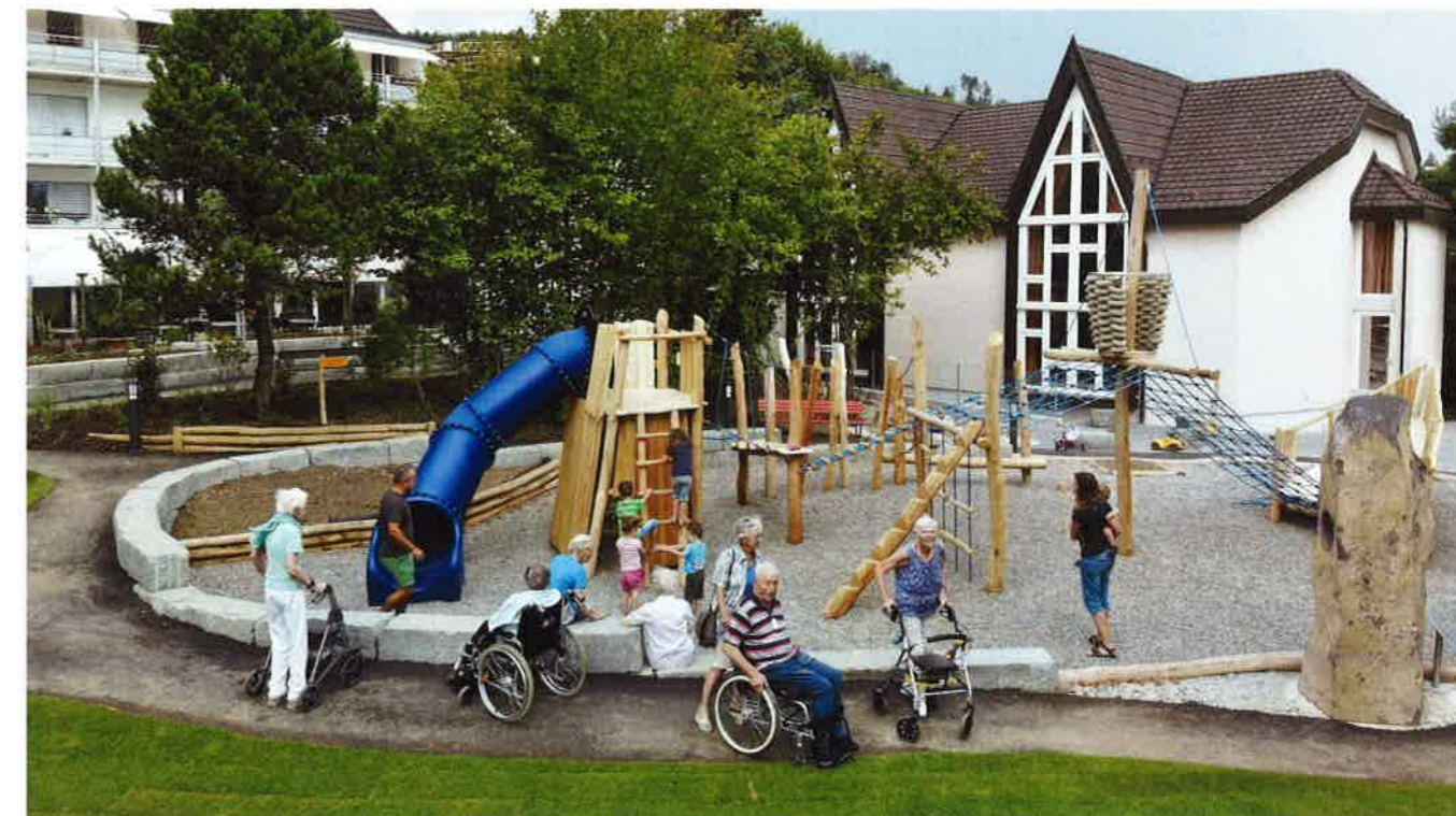
Begegnungsstätte für Jung und Alt mit vielfältigen Spiel- und Erholungsmöglichkeiten